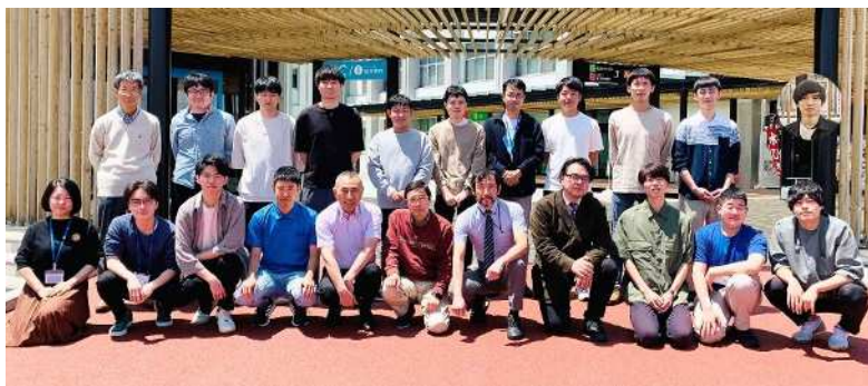
南信州・飯田サテライトキャンパス 学生・教職員（2023.4.1） 航空機システム共同研究講座、大学院航空機システム分野横断ユニット

電子情報システム工学分野専任、航空機システム分野横断ユニット併任、航空宇宙システム研究拠点 基盤技術部門 専門；電気機器、エネルギー変換 主な研究テーマ；リニア発電機の開発とモバイルシステムへの応用、電力変換、他