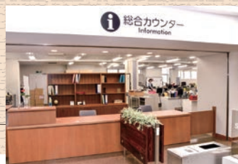
中央図書館総合カウンター