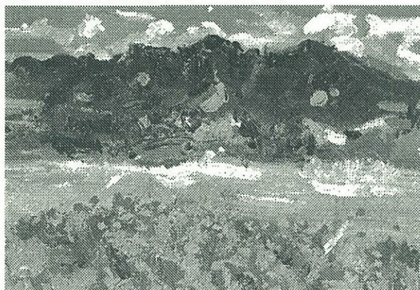
初夏の岡からの遠望

奈良では「あなたの町の景観診断」と称して景観調査をした。大和の農村では「人工的な白い空間」を好み、農業公園を作り、擬似農業を地域のこどもたちに体験させ、沿道を農作物ではなく、花を植える運動を展開していた。農村を忘れ、農村が破壊された光景が随所に見られた。上田の農村でも同じ、専業農家が5%を切る、誰が後継者なのか、誰がリンゴの樹の剪定ができるのか、勤め人の息子世代では無理、孫の世代が受け継ぐことができるのか、掛け声だけの“美しい日本”ではなく、農業産業の経済的再生こそ、景観再生にとっても望まれるのである。