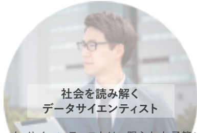
社会を読み解く データサイエンティスト

データ・サイエンティストは、限られた予算や人的資源、時間などを分析・最適化し、精度の高い戦略やイノベティブな事業提案を行うスペシャリストです。本コースでは社会調査士などの資格を獲得可能な授業がありますので、それらを認定科目として受講しながら、現場で活用し、データ・サイエンスの実践力を身に付けます。