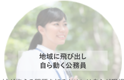
地域に飛び出し 自ら動く公務員

地域が抱える問題を知るためには自らが現場に足を運び、時には当事者となる必要があります。また、課題解決のためには、地域や役所内の人や部署を横断的に連携させた事業の創出が求められます。本コースでは、公務員志望者が地域での課題を体験し、それを解決するプロデューサー人材となる力を身に付けます。