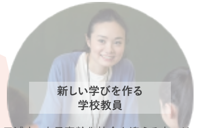
新しい学びを作る 学校教員

人口減少・少子高齢化社会を迎える中では、その現場ごとの状況に合わせて解決方法を考える課題に子供達は取り組まなければなりません。本コースでは、教員志望者自らが地域課題解決の実践経験を積み、課題解決の現場で求められる「課題設定力」「創造力」「連携力」「適応力」を養う場を設計するノウハウを身に付けます。