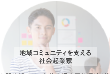
地域コミュニティを支える 社会起業家

中山間地域では、公共交通や買物環境が消失し、祭事などの文化も維持できなくなる状況が発生しています。本コースでは、連携している様々な企業や団体から、ITサービスやデザイン、事業創出の実践事例を学ぶことで、地域コミュニティの再生・維持に繋がるアイデアを創出・実現させる人材になる力を身に付けます。