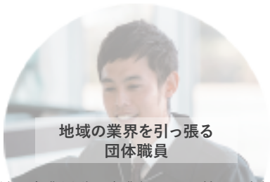
地域の業界を引っ張る 団体職員

地域の企業活動や産業振興に貢献する支援事業を考案するためには、念入りの調査やデータ分析はもちろん、企業や関係者との信頼関係構築が必要不可欠です。本コース参加者は、インタビュー等から課題分析を行う基本的な調査能力を身に付けるほか、インターンシップ等で、プランニングやワークショップ運営を学びます。