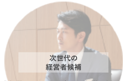
次世代の 経営者候補

企業経営においては、ブランド経営や新たな企業価値/評価に対応した知識や経営ノウハウが必要です。また自治体でもEvidenceベースの政策策定が求められています。本コースでは、グローバル企業や大手企業の経営者、行政の首長らからの講義・ディスカッション等を通じて、未来志向、組織マネジメントの視点を学びます。