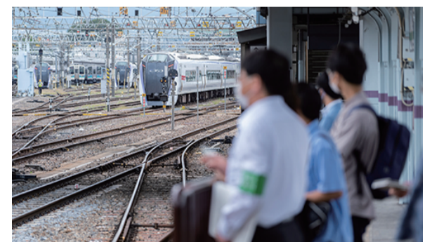
JR、NEXCOなどの企業との連携で現場・リアルな課題を扱います